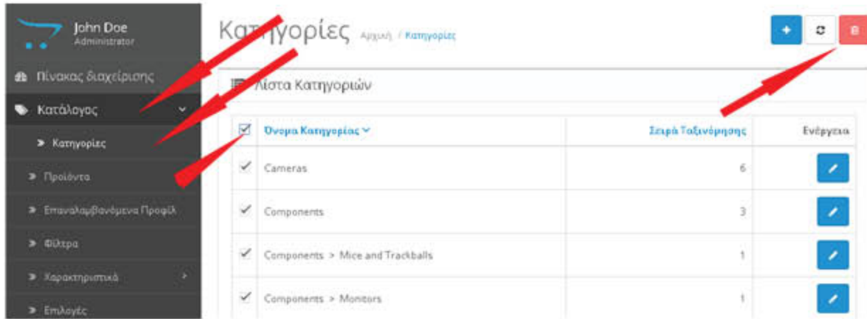
Εικόνα 1.2 Διαγραφή Κατηγοριών

Δίπλα από το όνομα της κατηγορίας (Category Name), θα δείτε ένα μικρό κουτάκι. Κάντε κλικ και θα επιλέξετε όλες τις υπάρχουσες κατηγορίες. Κάντε κλικ στο εικονίδιο trash για να διαγράψετε τις κατηγορίες.